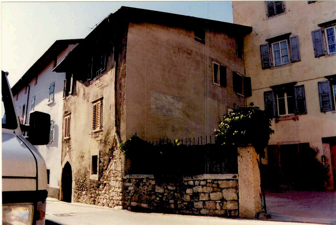
Documentazione fotografica - Immagine 2 (Rif.archivio:negativo ___ fotogramma ___)